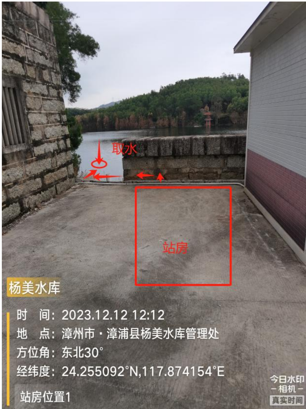
水站点拟建站房与取水现状图 1